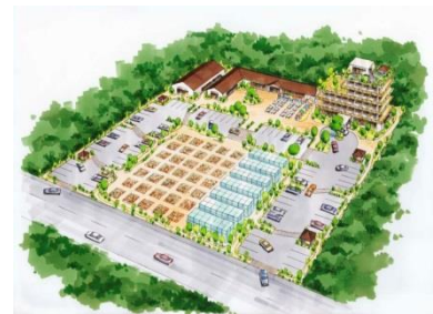
持続可能な善循環型真農業・福祉コミュニティ構想図